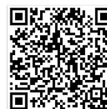
住院線上訂餐(普通飲食)

一般飲食可自行使用【住院線上訂餐】QRcode 進行連結提出訂餐需求，我們會按照供餐時間送餐至病房。